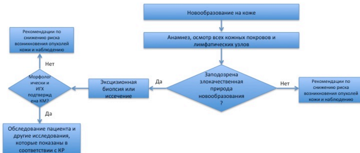
Блок-схема 1. Диагностика и лечение пациента с подозрением на опухоль кожи (КМ)